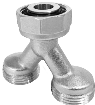
РАЗДЕЛИТЕЛЬ ПОТОКА КОЛЛЕКТОРНЫЙ